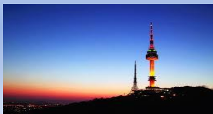
- Обсерватория на телебашне на горе Намсан