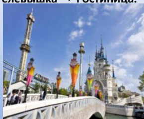
- Парк аттракционов Лотте волд

Гостиница → Парк развлечений Лотте Волд → Обед → Круиз по реке Ханган (*в дождь – морской аквариум в небоскрёбе «63 этажа») → Фабрика аметистов или женьшеневый центр → река Чхонгечхон → Сеульская телевышка → Гостиница.