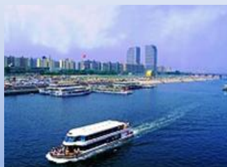
- Круиз по реке Ханган