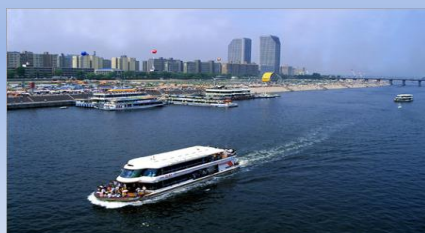
- Круиз по реке Ханган

Гостиница → Гостиница Виа Лотте (Сеул) → Ужин (*Меню: Пульгоги) → Универмаг в гостинице Виа Лотте → Ночной круиз по реке Ханган (*С апреля по октябрь можно полюбоваться фонтаном Лунный свет на мосту Банпо/ *Продолжительность круиза 70 мин.: остров Ёидо – мост Банпо – остров Ёидо) → гостиница Виа Лотте, Сеул → обсерватория на телебашне на горе Намсан → гостиница