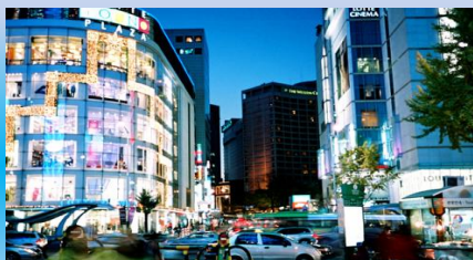
- Район модных магазинов Мёнгдон

Гостиница → гостиница Виа Лотте, Сеул → район модных магазинов Мёнгдон → универмаг Дутта в районе Тонгдэмуна → Рынок Квангджан → рынок Намдэмуна → универмаг Лотте (Сеульский вокзал) → гостиница.