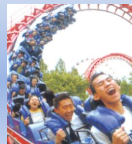
Тематический парк Эверлэнд