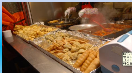
- Рынок Квангджан