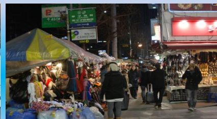
- Рынок Намдэмуна